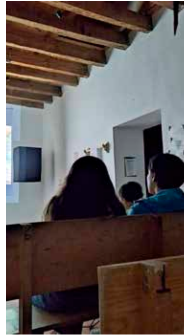
como Metepec y Valle de Bravo.