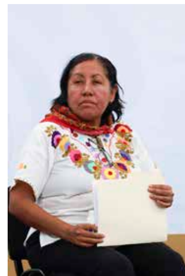
cia en Atenco “para amedrentar a toda la protesta social en contra de

En medio de gritos y consignas que refrendaban la lucha del pueblo atenguense, la representante de la comunidad destacó que el Estado actuó entonces con violen-