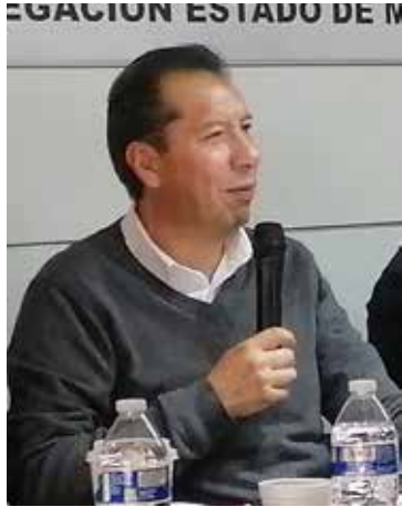
Añadió que vecinos de colonias aledañas a las estaciones del Tren Interurbano ‘El Insurgente’ han

“El problema no es el transportista, el transporte o los sistemas de transporte, es la anarquía, el que hay autoridades que no están comprometidas”, aseveró.